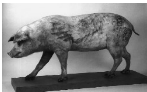
Varken - Wim Delvoye