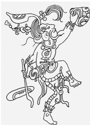
Regengod - Chac

De paperback editie (oktober 2004), opgesmukt met vele zwart-wit afbeeldingen van tempels en gebouwen, maar ook van schrifttekens, formaat 14 x 20 cm. en 180 blz., kost 13,95 Euro. Het is best te bestellen, rechtstreeks of langs en boekhandel S. Roeling, ( mayaweb@planet.nl ).