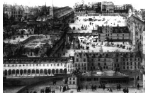
Hof van Brabant - Coudenberg