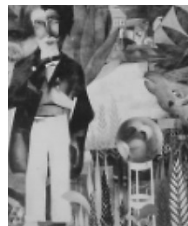
De Gek - 1926