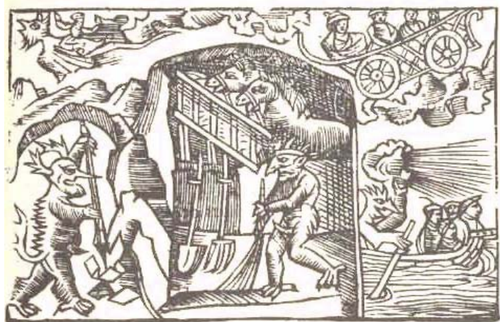
De duivel als verwekker van onheil en rampen

Wier ziet dit als een verklaring voor het ontstaan van de vele nieuwe ziekten in een tijd waarin de mens onchristelijk leefde. Dit past ook in het beeld van de wrekende God.