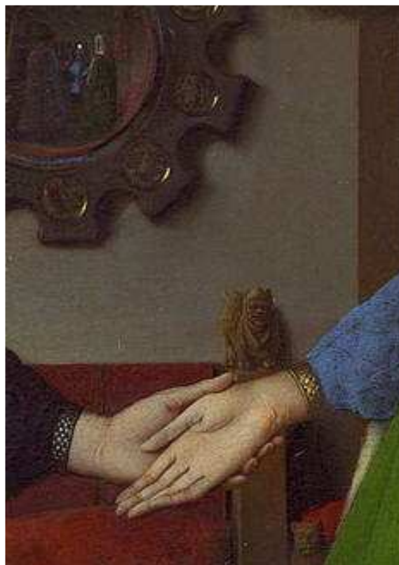
Fig. 2. Jan Van Eyck. Het Arnolfini Dubbelportret. London, National Gallery. De vrouw lijdt aan uitdrogingsdermatitis van de handen en heeft een litteken op de linker pols.

Op het prachtige portret van kardinaal Albergati door Jan Van Eyck vindt men op het voorhoofd rechts een huidskleurige koepelvormige tumor met alle kenmerken van een sebuncyste , een week fibroompje tussen het linker oor en de schedel en een halfbolvormig gezwel op het voorste derde van de linker ramus mandibulae (fig. 5).