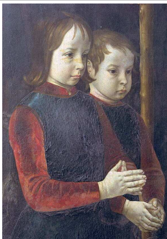
Fig.3. Hugo Van Der Goes. Portinari triptiek. Florence, Galleria degli Uffizi. Atopische dermatitis bij twee kinderen van de schenker.