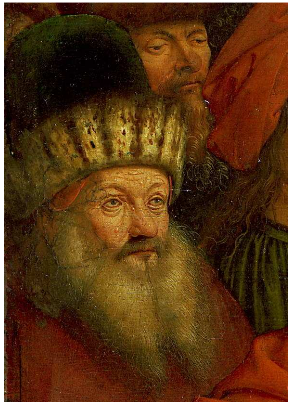
Fig.1. Jan Van Eyck. Lam Gods. Gent, Sint-Baafskathedraal. Centrale paneel, detail profeten. Actinische elastose met miliumcysten en comedonen bij de persoon links. Pigmentnaevus op de neustop bij de rechter persoon.

Chronisch eczeem gaat gepaard met lichenificatie . Hieronder verstaat men een accentuering van de huidtekening, zodat de huidoppervlakte grof en ruw wordt. Dit kan gezien worden op de afbeelding van Sint Antonius die met de bel in de hand op het linker zijpaneel van het Portinari triptiek weergegeven is. De huid van de pols en van de handrug is verdikt en de huidtekening is er versterkt. De heilige lijdt tevens aan chronisch rheuma met zwelling van de metacarpophalangeale en interphalangeale gewrichten.